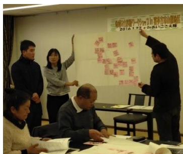
ワークショップ風景 (2016年1月 福島県喜多方市山都地区)